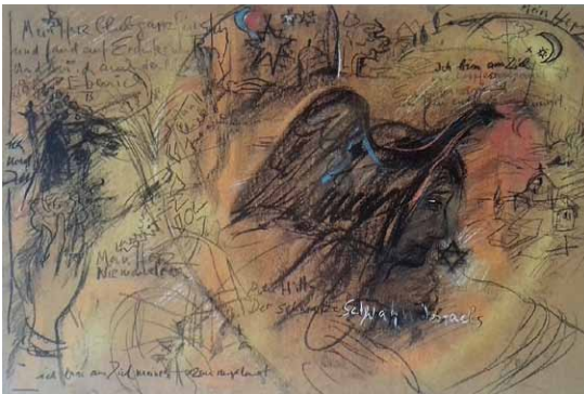
Bild Links: Albrecht Dürer, Weiher im Walde, um 1495, The British Museum

Das Else-Helene-Fest auf dem Laurentiusplatz wird begleitet vom dritten Forum der Initiativen, an dem zahlreiche Öko-, Klima-, Ernährungsinitiativen teilnehmen.